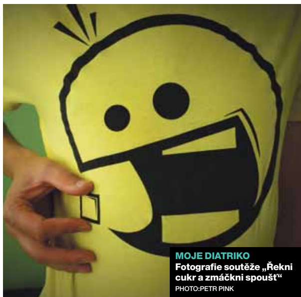
MOJE DIATRIKO Fotografie soutěže „Řekni cukr a zmáčkní spoušť“