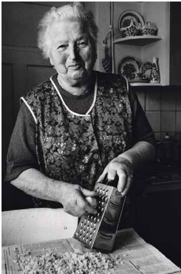
DOMÁCÍ KUCHYNĚ. Fotografie soutěže „Řekni cukr a zmáčkni spoušť“

Přijímaná potrava by měla odpovídat výživovým požadavkům dospělého člověka a některé hodnoty by neměly přesáhnout určitou hranici.