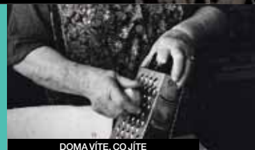
DOMA VÍTE, CO JÍTE