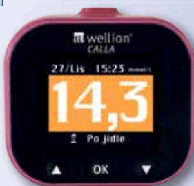
Glukometr Wellion Calla Premium