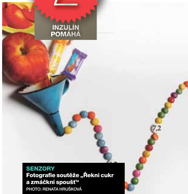
SENZORY Fotografie soutěže „Řekni cukr a zmáčkní spoušť“